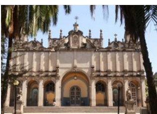
Yirga Alem 📍 🚗 325km - 🕒 6h