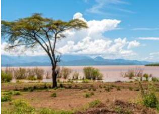
Arba Minch 📍