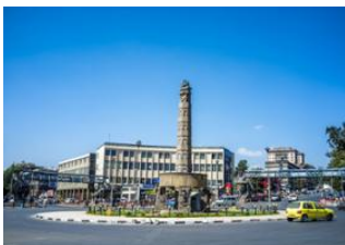
Addis - Abeba 📍