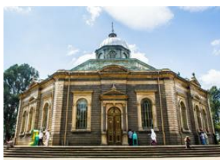
Addis - Abeba 📍