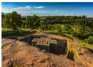
Addis- Abeba 📍