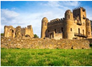
Bahir Dar 🚗 180km - ⌚ 4h Gondar