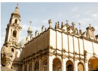
Lalibela 📍 ✈ 865km - 🕒 50m Addis - Abeba 📍