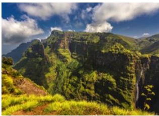
Parc National Simien