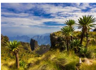
Parc National Simien