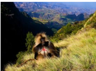
Gondar 🚗 100km - ⌚ 1h 30m Parc National Simien