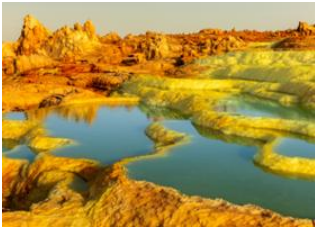
Ahmed-Ila 📍 🚗 180km - ⌚ 6h Danakil 📍