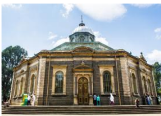
Addis - Abeba 📍