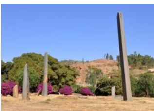
Addis - Abeba 📍 ✈️ 1000km - ⌚ 1h Axum 📍